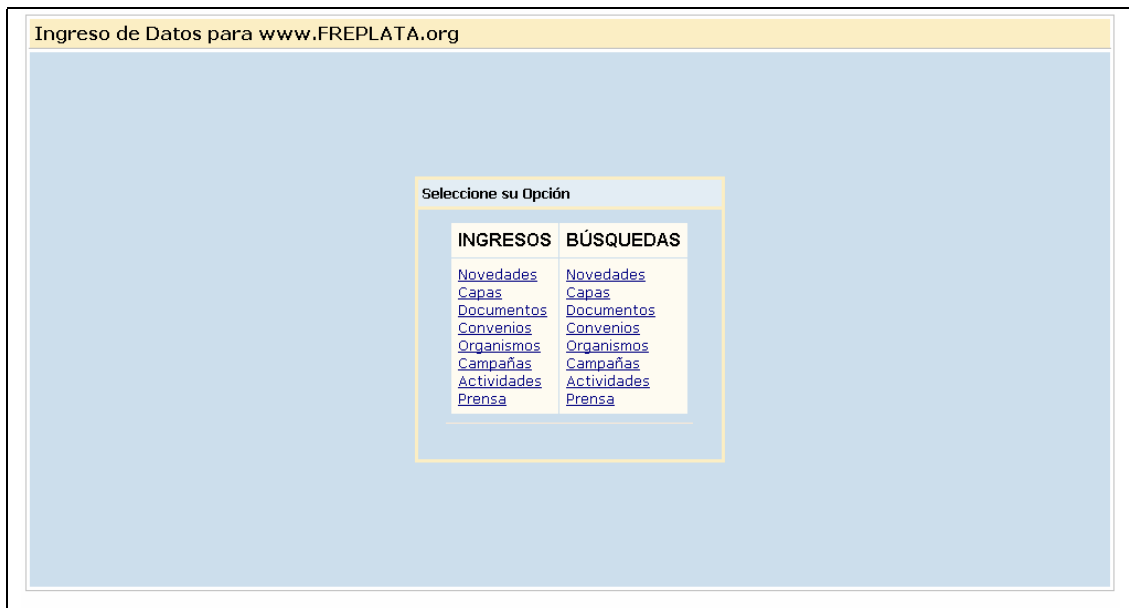
Fig. 2 – Página principal del Sistema

En ésta página, para Convenios se nos presentan las siguientes opciones: