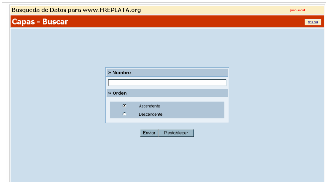
Fig. 6 – Buscar Capas

Seleccionando la opción Buscar en la página principal, se ingresa a la página Buscar Capas (Fig. 6), que permite buscar una o más Capas para modificar. Para ellos se deberán definir en primer lugar los criterios de búsqueda con los cuales cumplirán las Capas buscadas.