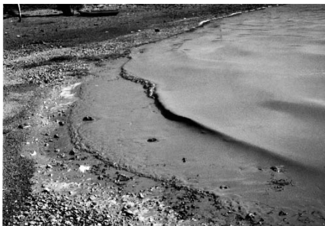
Figura 1. Aspecto de una floración de cianobacterias formando espuma, debido a la alta densidad, en la costa de un sistema de agua dulce.

Las floraciones algales, también conocidas como “blooms”, son eventos de multiplicación y acumulación de las microalgas que viven libres en los sistemas acuáticos, o fitoplancton, (Figura 1) y que presentan un incremento significativo de la biomasa de una o pocas especies, en períodos de horas a días. Estos eventos ocurren naturalmente en los sistemas acuáticos. Sin embargo, se ha registrado un incremento mundial en su frecuencia y duración, asociado a las condiciones de eutrofización de los cuerpos de agua (Hallegraeff, 1992; Paerl, 1996).